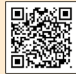
当共済組合ホームページ

実施機関として掲載されていても、受診券を利用できない場合があります。予約時に、受診券を利用できるか必ず確認してください。