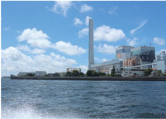
磯子区 海から見るJ-POWER磯子火力発電所