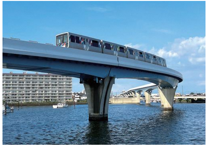
金沢区 平瀬湾のシーサイドライン