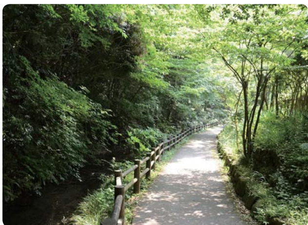
▲ 旭区 帷子川親水緑道

見やすく分かりやすい情報発信にも力を入れており、とくに横浜市職員共済組合のホームページでは、お問合せの多い質問をトップページに掲載し、各種手続きについて確認をしやすくなっています。ブルーを基調とした爽やかで親しみやすいホームページは、下記のQRコードやアドレスから開くことができます。ぜひ一度、ご覧ください。