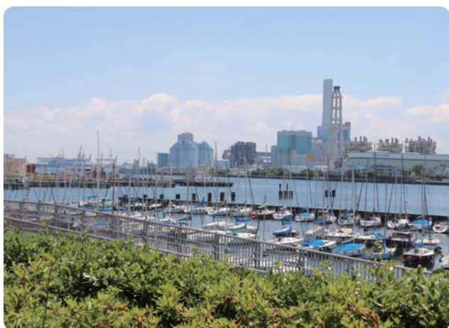
▲ 磯子区 磯子・海の見える公園

横浜市の職員等で横浜市職員共済組合の組合員証(保険証)を持っている方です(組合員証を持っていない退職派遣中の職員も含まれます)。