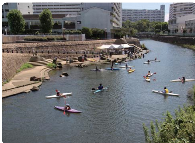
▲ 保土ケ谷区 帷子川親水広場