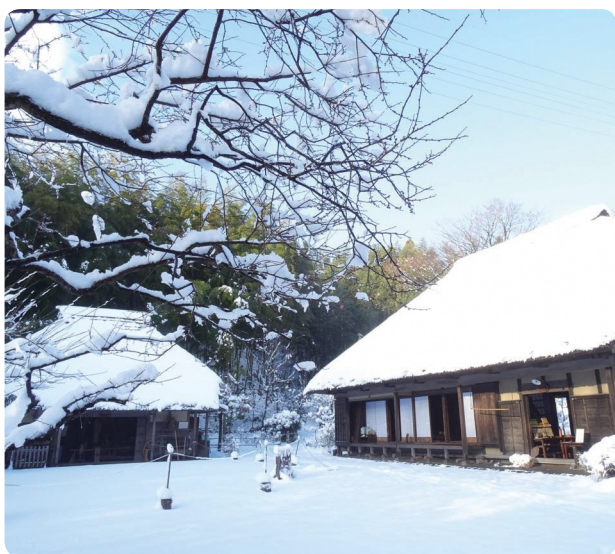
▲ 戸塚区 舞岡公園 小谷戸の里

インフルエンザ予防対策 … 4 共済の窓(がん検診を受けましょう) … 4 生活の知恵袋 … 4