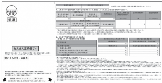
※50歳未満の方宛圧着ハガキイメージ。

■ 35歳、45歳及び59歳の方 封筒に通知とパンフレットを同封して送付します。