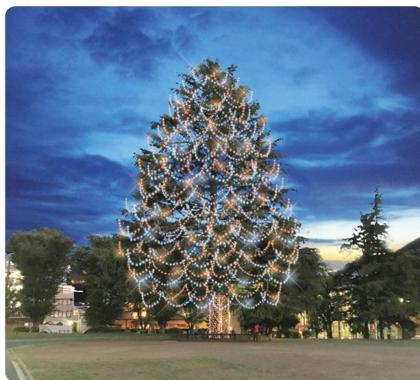
▲ 青葉区 美しが丘公園のペアツリー