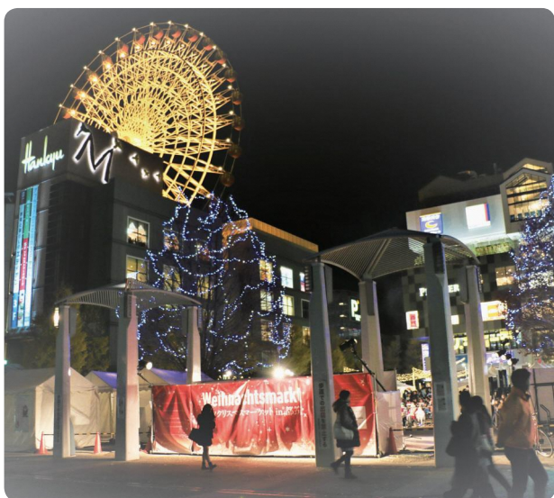
▲ 都筑区 ドイツクリスマスマーケット