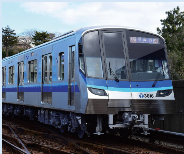
市営地下鉄ブルーライン 3000V 形