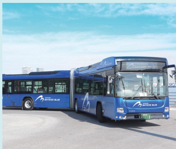
連節バス「BAYSIDE BLUE (ベイサイドブルー)」